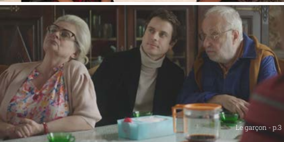
Le garçon - p.3