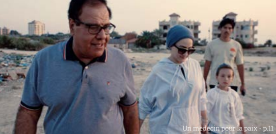
Un médecin pour la paix - p.11