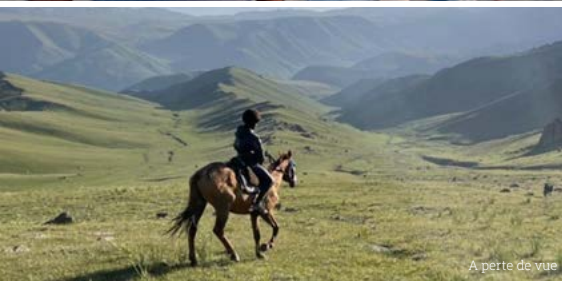
À perte de vue