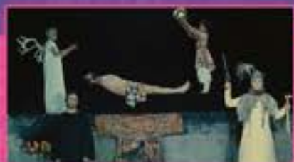
© 1969 L'ARCADE FILMS OF THE PHILIPPINES. Tous droits réservés.

Séance en partenariat avec la Cinémathèque de Grenoble