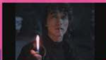
© 1988 L'ARCADE FILMS OF THE PHILIPPINES. Tous droits réservés.

Avec avertissement Séance en partenariat avec la Cinémathèque de Grenoble