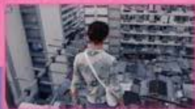
© 1997 HONG KONG INDEPENDENT FILMS. Tous droits réservés.

Séance en partenariat avec le Ciné-Club de Grenoble