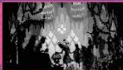
© 1976 SHINYA TSUKAMOTO/KAJIŪ THEATER. Tous droits réservés.

Réalisatrice du premier long métrage d'animation de l'histoire, Les Aventures du Prince Ahmed (1926), Lotte Reininger est une référence dans l'animation de silhouettes en papier découpé. Cette technique, au rendu visuel rappelant le théâtre d'ombres, a influencé nombre de réalisatrices et de réalisateurs dont Michel Ocelot pour Princes et Princesses . À l'issue de la séance, vous pourrez manipuler des personnages inspirés de ceux créés par Lotte Reininger et réaliser toutes ensemble une petite séquence grâce à un banc titre. Un atelier proposé par Benoît Letendre.